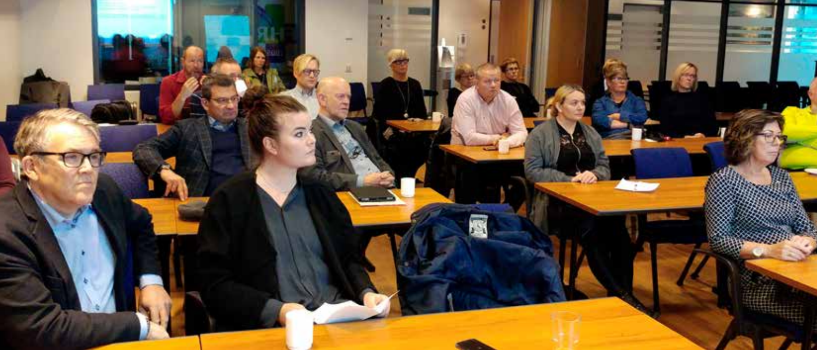
Verkefni og framtíðarsýn Bjargs íbúðafélaga voru kynnt félagsmönnum á morgunverðarfundi í september 2017.