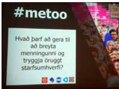
Fjölmargar hugmyndir og ábendingar komu fram á fundi verkalýðshreyfingarinnar með #metoo konum.

Heildarsamtök launafólks ásamt Kvenréttindafélagi Íslands stóðu sameiginlega að samráðsfundi með #metoo konum 10. febrúar 2018. Á fundinum, sem var haldinn með þjóðfundarsniði, voru mótaðar