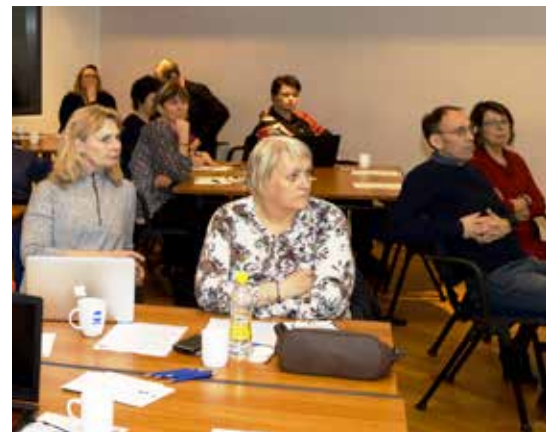
Á fyrsta menntadegi BSRB var meðal annars fjallað um fagháskólanám, raunfærnimat og hverjar áherslur BSRB eigi að vera í menntamálum.