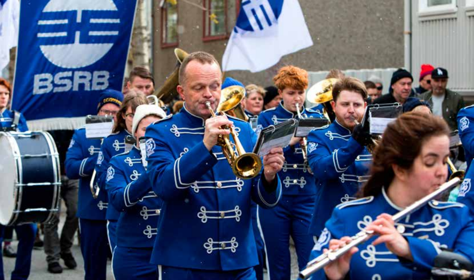
Lúðrasveitin Svanurinn leiddi göngu BSRB og aðildarféлага bandalagsins niður Laugavegin, venju samkvæmt.