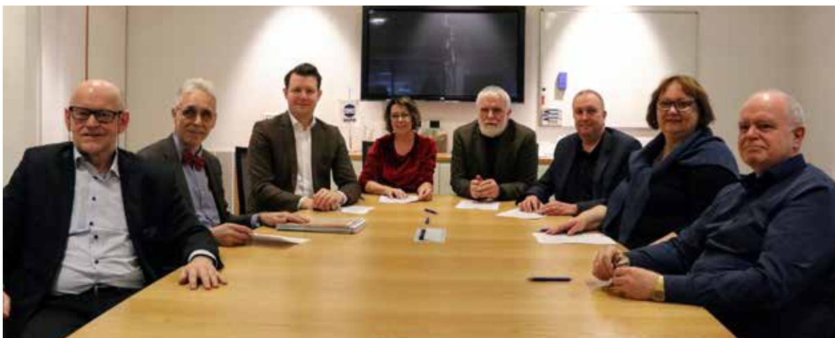
Fulltrúar BSRB, ASÍ, SA, ríkisins og Sambands íslenskra sveitarfélaga undirrituðu samkomulag um launabróunartryggingu í desember 2017 og aftur mars 2018.