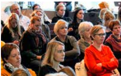
Um 2.200 starfsmenn borgarinnar tóku nú þátt í tilraunaverkefni um styttingu vinnuvikunnar.

Niðurstöðurnar eru almennt jákvæðar. Á flestum stöðum þar sem vinnuvikan var stytt hefur framleiðni haldist óbreytt þrátt