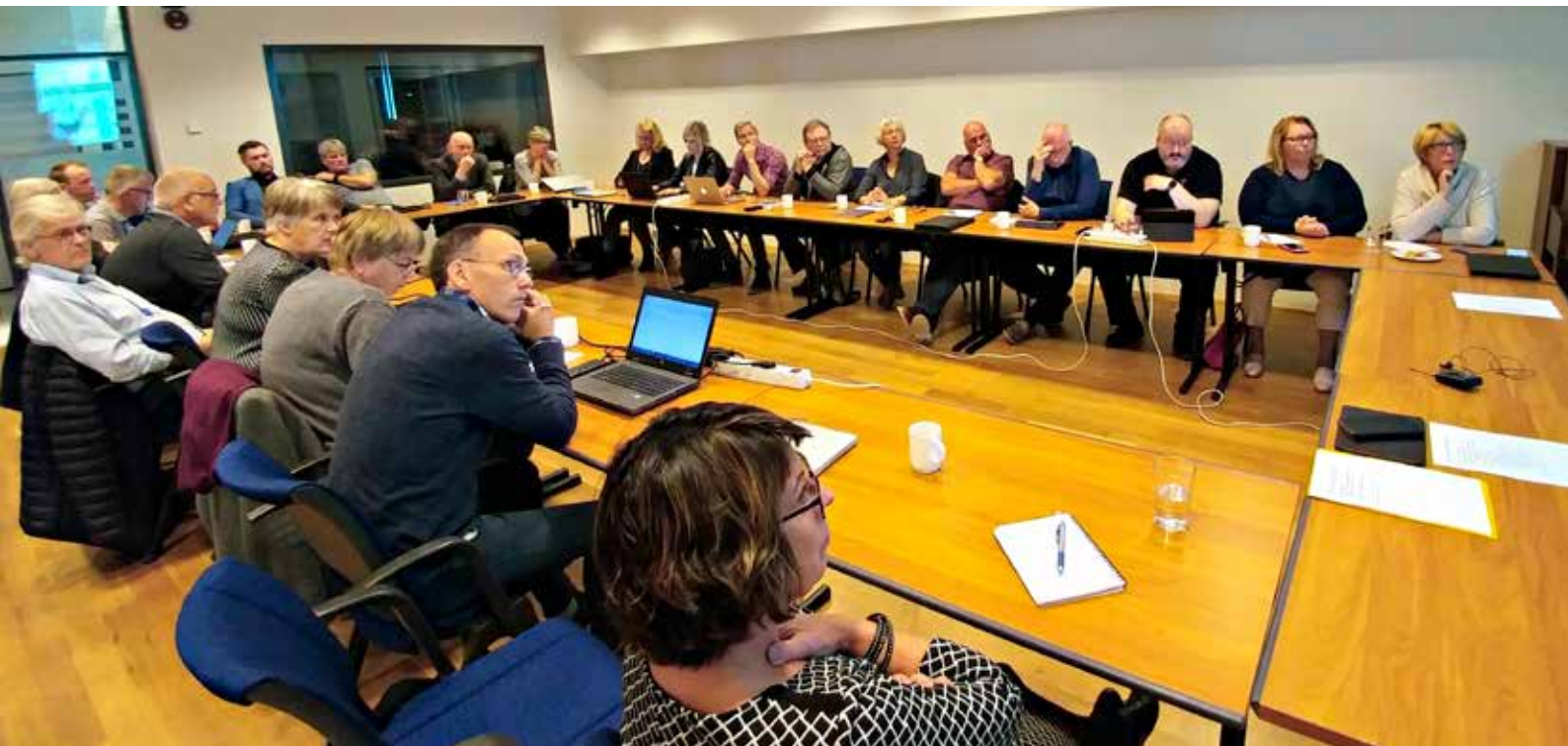
Formannaráð BSRB hefur fundað þrisvar á árinu til að ræða þau mál sem hæst hefur borið í starfsemi bandalagsins.

komid af stað og bregðast við henni. Fundurinn ályktaði í kjölfarið um næstu skref í tengslum við #metoo.