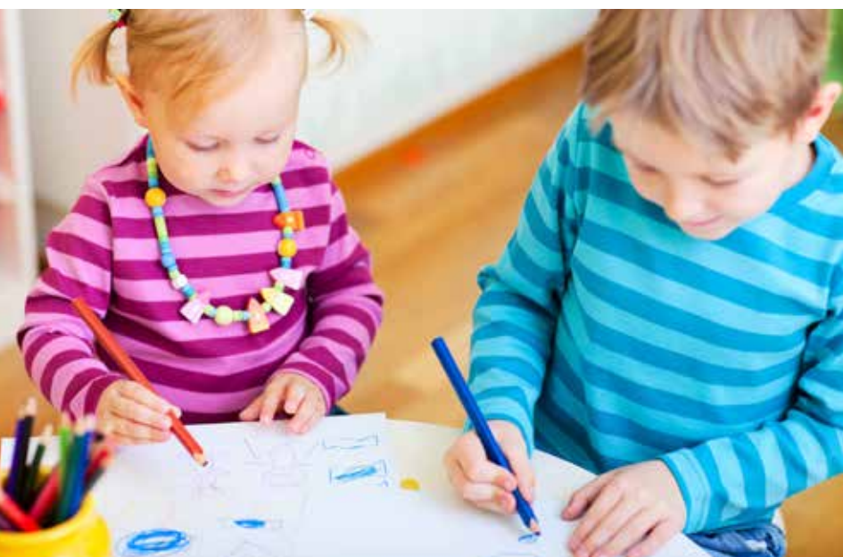
Ekki ríkir jafnræði í þjónustu við börn og foreldra þegar kemur að dagvistunarmálum.

Ný ríkisstjórn sem tók við völdum eftir kosningar haustið 2017 hefur lagt mikið upp úr samtali við aðila vinnumarkaðarins. Fundað var stíft frá byrjun desember út febrúar um ýmis málefni sem skipta BSRB og samfélagið máli. Þá hefur formaður bandalagsins ásamt 1. varaformanni eða framkvæmdastjóra fundað með einstökum ráðherrum um áherslur BSRB í þeim málaflökum sem undir þá heyra. Fyrsta stóra málið sem var tekið fyrir á fundum ríkisstjórnarinnar með