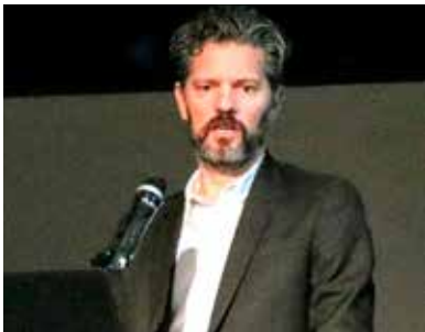
Dagur B. Eggertsson borgarstjóri sagði tilraunaverkefni um styttingu vinnuvikunnar þegar hafa skilað miklum árangri.

fyrir færri vinnustundir. Skammtíma-veikindi hafa dregist saman og starfsánægja aukist.