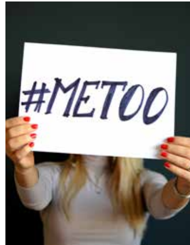
Fjallað hefur verið um #metoo byltinguna á fundum stjórnar og formannaráðs BSRB

Formaður BSRB flutti erindi á fundi Vinnueftirlitsins, Áreitni á vinnustöðum – NEI TAKK! þar sem undirrituð var viljayfirlýsing um aðgerðir gegn einelti, kynferðislegri áreitni, kynbundinni áreitni og ofbeldi á vinnustöðum.