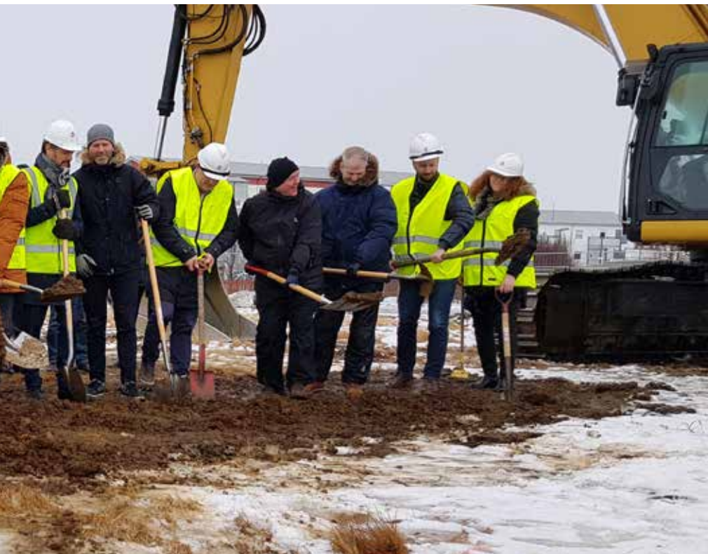
Íbúðakjarna Bjargs íbúðafélags í Spönginni í Grafarvogi í febrúar.

ákvörðun um að endurskipa í hópinn og fækka fulltrúum. Hann bauð BSRB og ASÍ að skipa sameiginlega einn fulltrúa. Því var hafnað og skipuðu því hvorki ASÍ né BSRB fulltrúa í hópinn. Mennta- og fræðslumál. Menntamál hafa verið í deiglu hjá BSRB undanfarin misseri bæði innan einstakra aðildarfélaga en jafnframt á sameiginlegum vettvangi innan mennta- og fræðslunefndar bandalagsins. Þá hefur BSRB jafnframt tekið þátt í sameiginlegri vinnu bæði að frumkvæði stjórnvalda en jafnframt með öðrum aðilum vinnumarkaðarins.