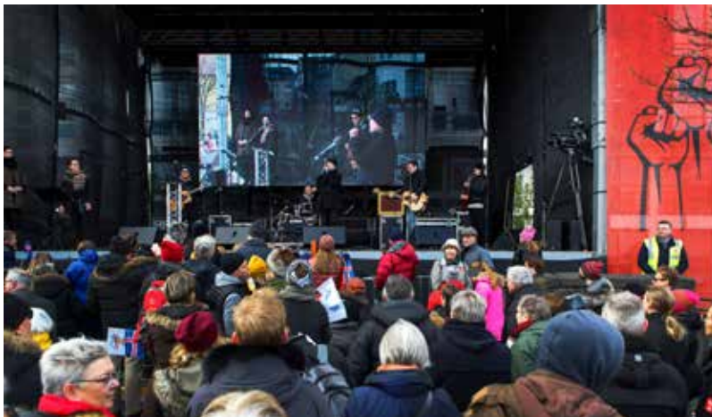
Afar góð mæting var í kröfugöngu og á baráttu- og samstöðufund á Ingólfstorgi þar sem mannfjöldinn hlýddi á ræður og skemmtiatriði.

Hún sagði að þolinmæðin gagnvart ofurlaunum sé nú endanlega þrotin og kallaði eftir breytingum á skattkerfinu fyrir tekju-lægstu hópana.