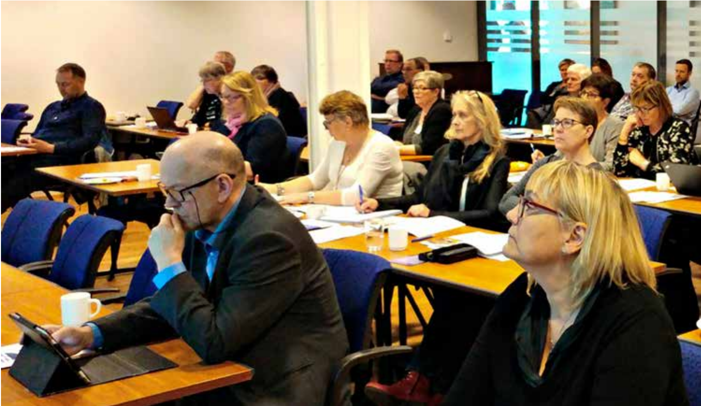
Á aðalfundi BSRB í fyrra var farið yfir samræmingu lífeyriskerfa, stofnun Bjargs íbúðafélags, átak í fæðingarorlofsmálum og fleira.